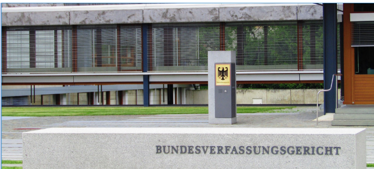
Im zweiten Halbjahr 2021 war es soweit: Das Verfassungsgericht erklärte den hohen, von der Finanzverwaltung angewendeten Zinssatz für verfassungswidrig. Der Fiskus kommt aber dennoch mit einem blauen Auge davon.